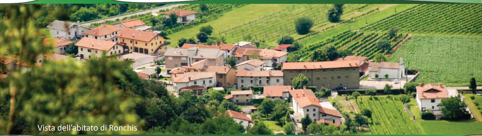
Vista dell'abitato di Ronchis

PUNTO DI PARTENZA: Torrealto - piazza A. Malignani