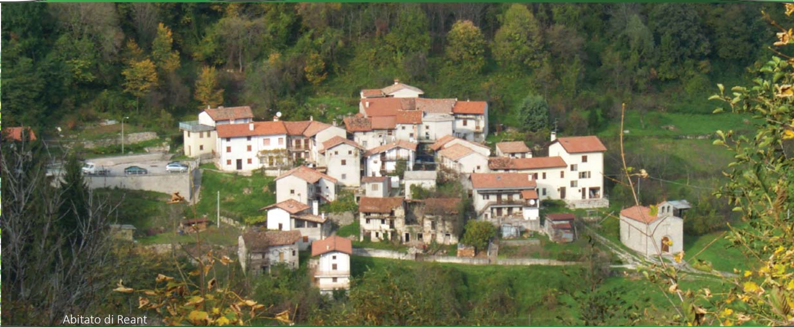
Abitato di Reant