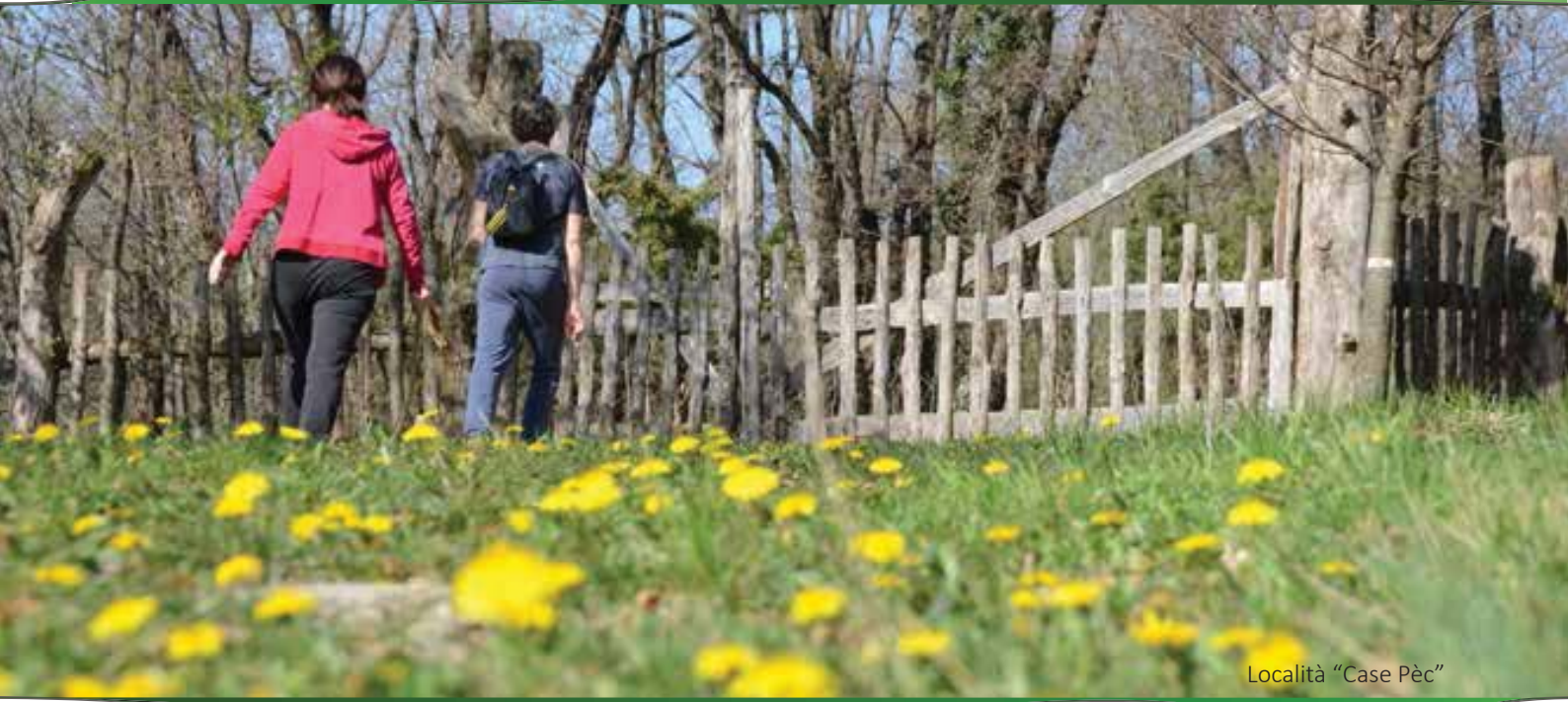
Località "Case Pèc"