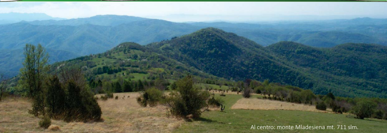
Al centro: monte Mladesiena mt. 711 slm.

PUNTO DI PARTENZA: Torreano - piazza A. Malignani