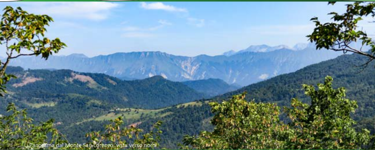
Panorama dal Monte San Lorenzo: vista verso nord